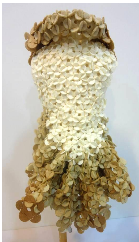
T I S 展覽作品 - 秋花舞